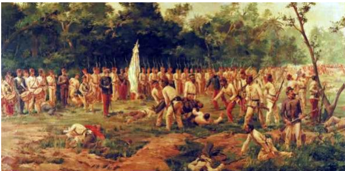
Obra del artista Juan Bautista Diógenes Hequet del Museo Histórico Nacional que se encuentra en custodia en el Salón de Honor del Batallón "Florida" de Infantería N° 1 desde el año 1998.